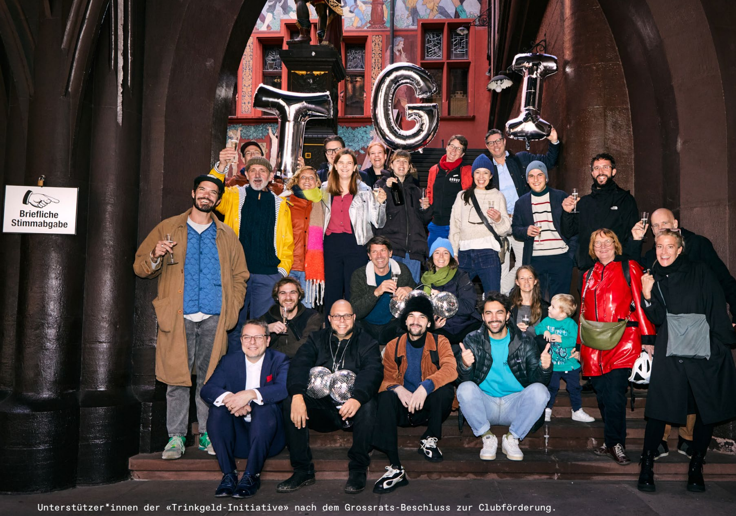
Unterstützer*innen der «Trinkgeld-Initiative» nach dem Grossrats-Beschluss zur Clubförderung.

schüttung an Fördergeldern antworten. Dank rückwirkend gesprochenen Fördergeldern konnten wir 2023 ein Total von 301500 Franken an professionelle Musiker*innen und Bands der Region Basel vergeben.