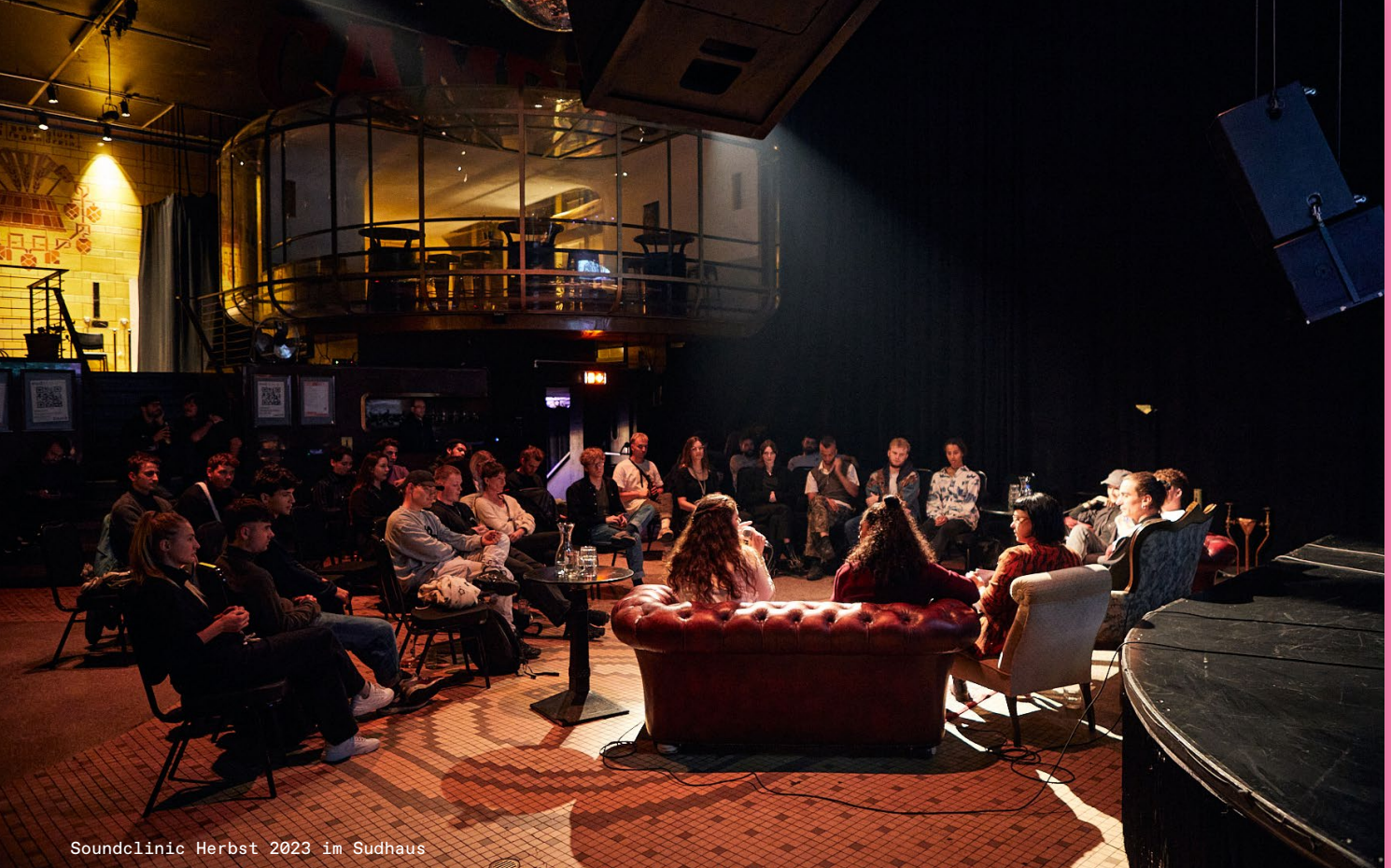
Soundclinic Herbst 2023 im Sudhaus