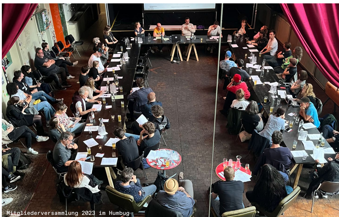
Mitgliederversammlung 2023 im Humbug